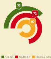
per dimensione (valori %)